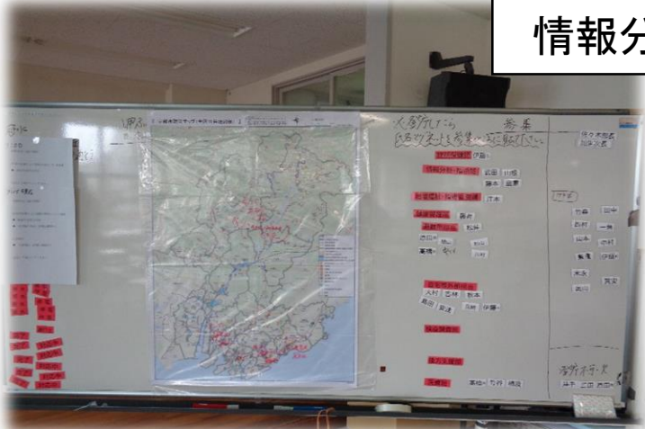
情報分析・指示班