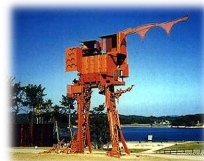
ときわ公園の彫刻