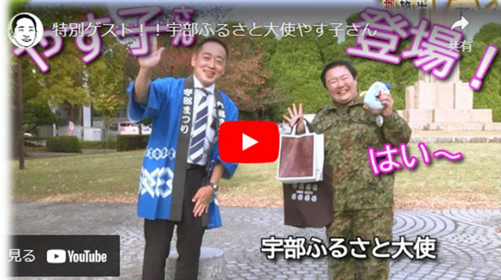
宇部ふるさと大使